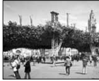
Lille 2004, La forêt suspendue.

laisser la dénomination « art » à sa variante populaire – confiant de ce que le système mangera soi-même cet enfant qui est le sien – et chercher des formes et des méthodes,