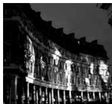
« Nuit blanche », Paris, 2003.

La bourgeoisie traditionnelle, principalement sédentaire et jouant un rôle déterminant dans le développement culturel d'une ville ou d'une société, est en voie d'extinction. Elle est remplacée par des commandos mobiles d'action rapide, formés de forces productives qui, en peu de temps, exploitent une ville pour aussitôt disparaître comme ils sont apparus. L'individu est partout, l'ubiquité est l'exigence du monde connecté. L'effectivité est le moteur et le travail de surface la seule possibilité d'équilibrer dans les comptes le rapport coût / utilité – pensée. En revanche, l'art, en sa qualité d'élément intégré à une situation urbaine, attend et exige de la continuité – c'est un processus de longue haleine qui a besoin du « temps ». Il a également besoin d'un vis-à-vis qui a lui-même du temps, qui prend du temps et qui, tout particulièrement, voit la discussion qui lui est proposée comme une part de son quotidien et une façon