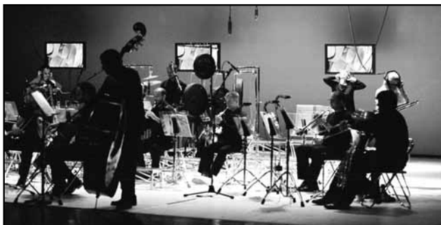
L'orchestre de Philomela .

Puisque j'avais écrit un texte qui avait une forme, le problème était de savoir comment lire ce texte, et c'est à ce sujet que nous avons échangé nos idées. Je tenais également beaucoup à prendre de la distance par rapport à mon propre texte. Ce processus de distanciation venait aussi en partie de la manière dont